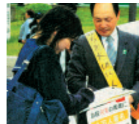
自殺対策基本法制定を求める署名運動(秋田駅前)