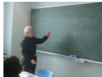
面談による相談(蜘蛛の糸事務局)