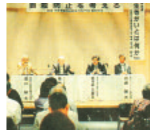
自殺防止を考えるフォーラムディスカッション(秋田市)